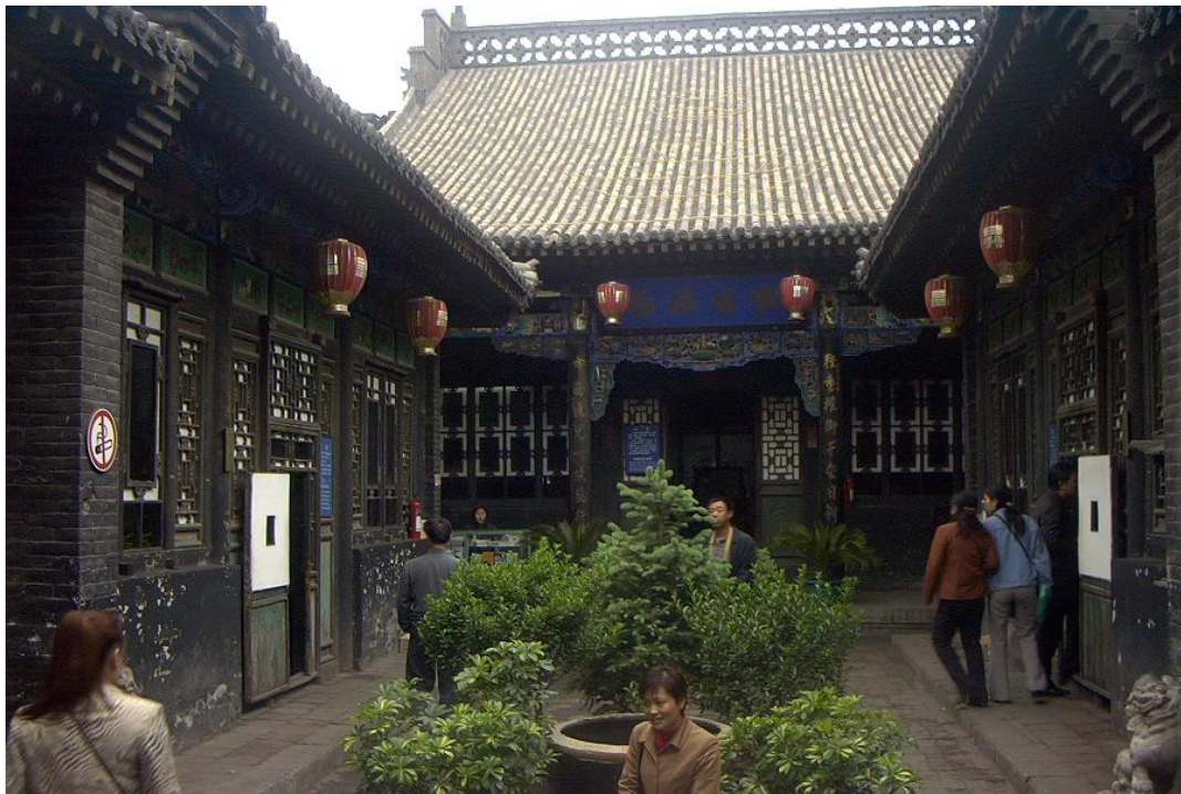
图 5：平遥日升昌票号遗址