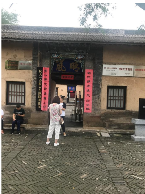
图 7: 屯留抗大一分校旧址

抗战全面爆发后，为适应新形式需要，边区决定成立抗大一分校（图 7），为根据地培养干部。经过组织动员，抗大一分校迅速成立，全校教职工及全体学员共计 3000 余人。1939 年 1 月 3 日，这一支队伍踏上了征程，从陕北来到太行，经过一个多月的行军，到达屯留故县一带。2 月 23 日，举行了开学典礼，八路军副参谋长左权专门做了重要报告。抗大一分校前后共三个支队九个营，分别防在附近的东古、崔蒙、东旺、