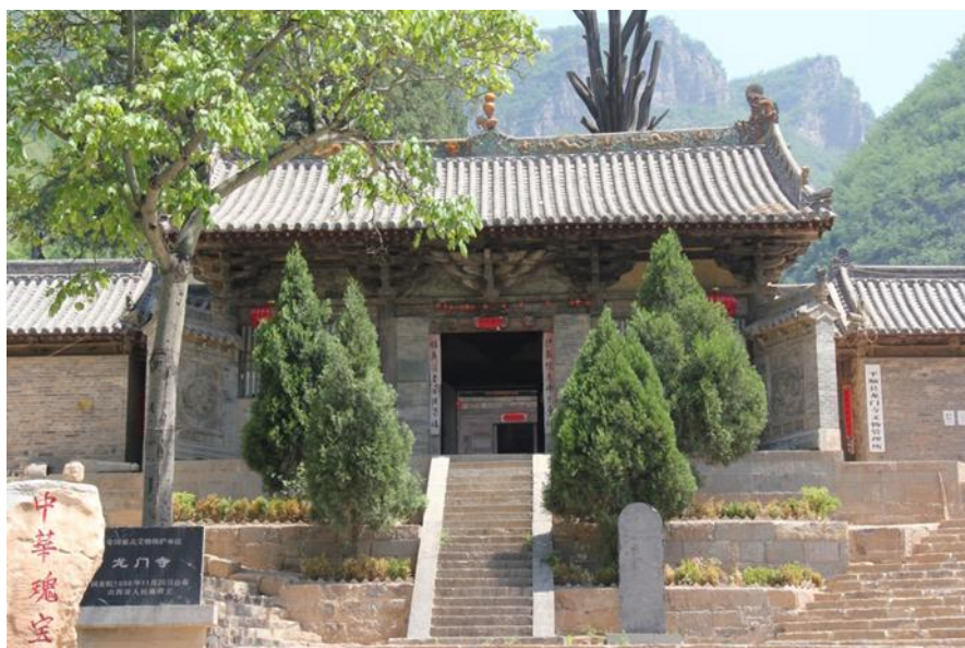
图 6: 平顺龙门寺